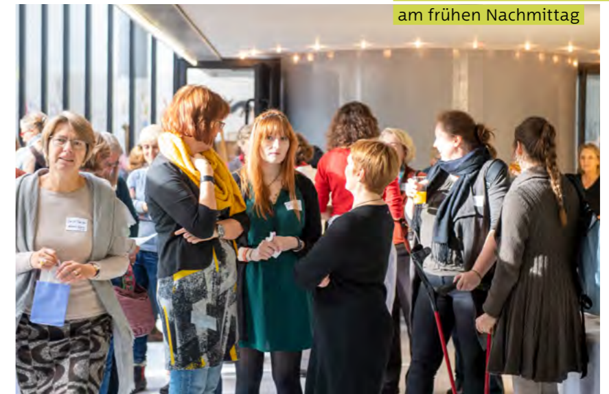
Ankommen der Teilnehmenden am frühen Nachmittag