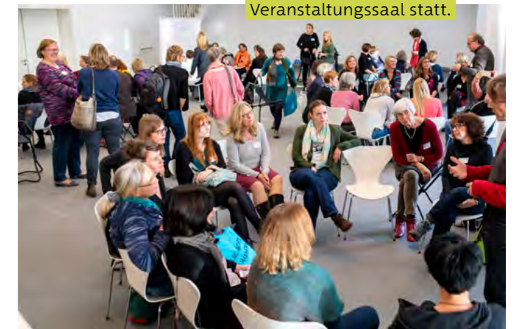
Organisation auf kleinem Raum: die sechs Austauschrunden fanden im Veranstaltungssaal statt.