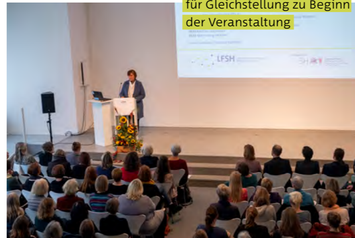
Grußworte der Ministerin für Gleichstellung zu Beginn der Veranstaltung